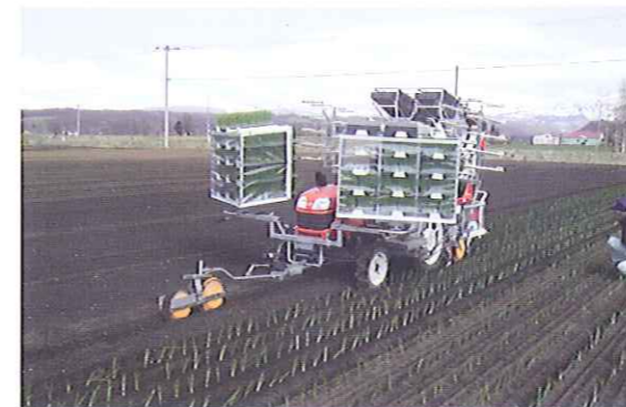
座ったままで移植作業が可能

送り出し爪・タイミングベルト・シャッター板 送り出し爪・シャッター板を改良し、きれいな植付け姿勢を可能にしました タイミングベルトの変更により、より高速な移植作業が可能になりました。