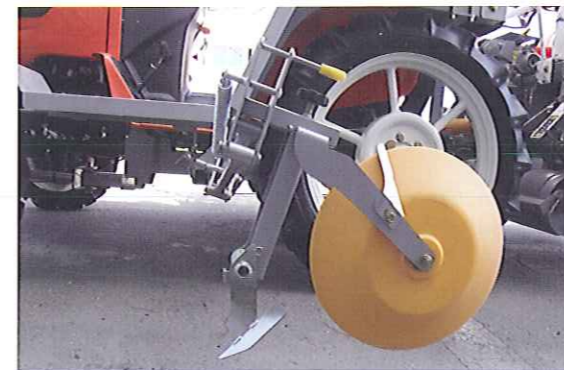
カルチ爪搭載の筋付けマーカ