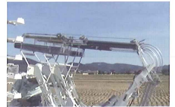
4枚収納可能空箱受け