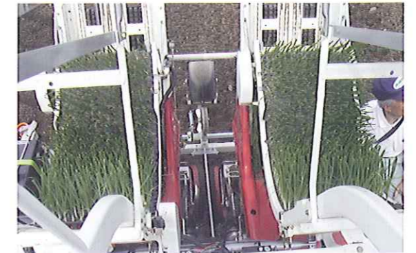
1ユニット苗箱連続3枚の移植作業が可能