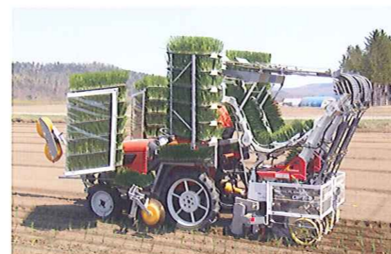
植付け作業状態 スイング式土寄輪を採用し安定した鎮圧が可能